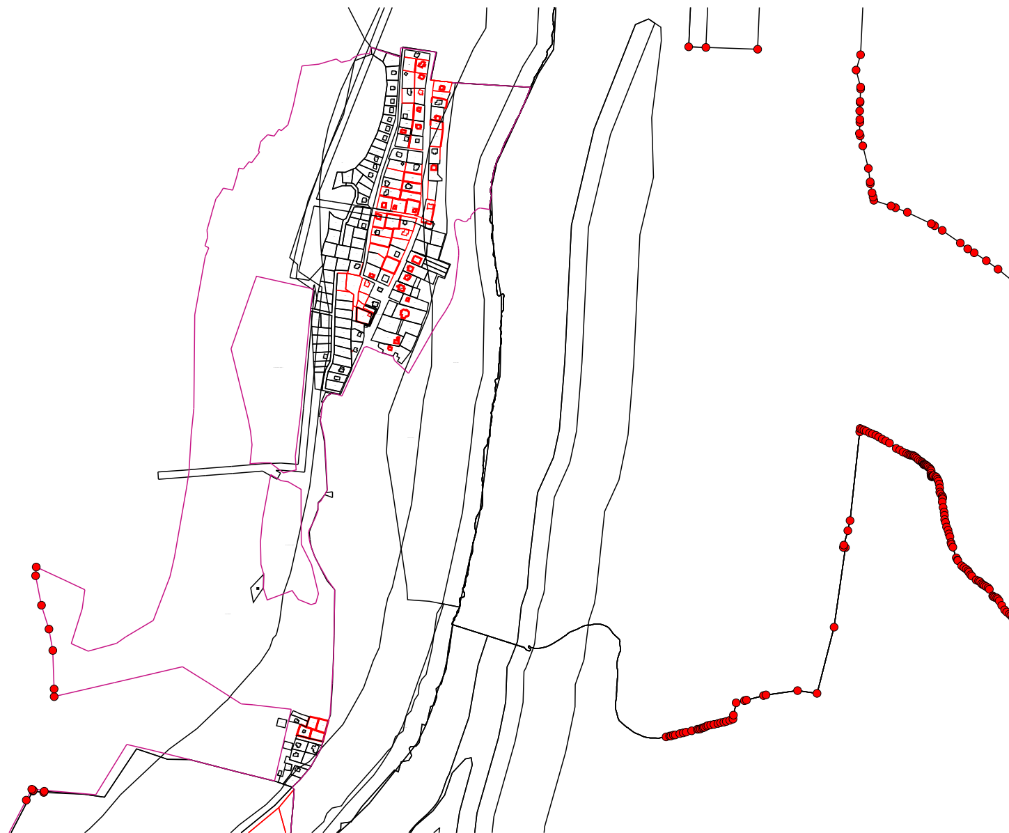
Схема границ земельных участков